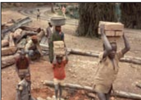
Kinderen aan het werk.