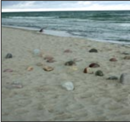
Levenscirkel aan het strand van Jastrzebia Gora, Polen.

Alles wat de Kracht van de Wereld doet, wordt gedaan in een cirkel. De hemel is rond en ik heb gehoord dat de aarde rond is als een bal en de sterren ook. Als de wind op zijn krachtigst is, wervelt hij. Vogels maken ronde nesten want hun religie is dezelfde als de onze. De zon komt op en gaat onder in een cirkel. De maan doet het zelfde en beide zijn rond. Zelfs de seizoenen vormen een grote cirkel in hun wisseling en komen altijd terug bij waar ze waren. Het leven van een mens is een cirkel van kindertijd naar kindertijd. En zo is de cirkel overal waar kracht beweegt. Zwarte Eland, Oglala Sioix (1863 - 1950)