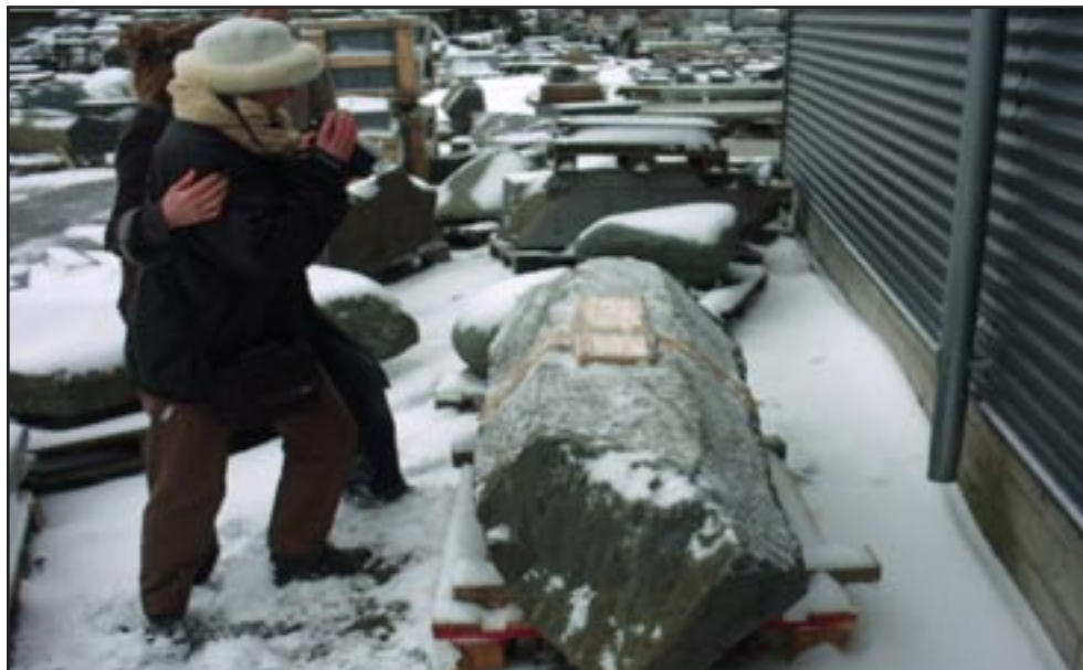
Deze columnar joint (basaltkolom) komt naar Nederland.