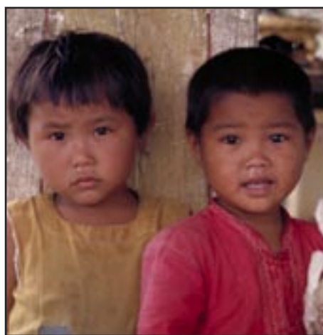
Roos: voor kinderen

De gemiddelde kosten van een steen zijn ongeveer acht à tienduizend Euro. Wanneer u minimaal € 17,50 overmaakt naar Stichting Roos, onder vermelding van uw naam en adres, helpt u mee het monument te realiseren en ontvangt u ook komend jaar onze nieuwsbrief.