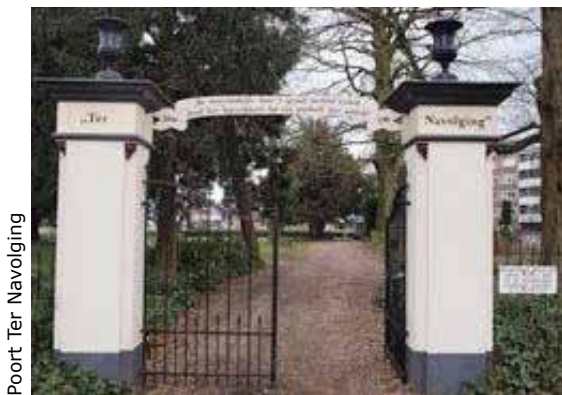
Poort Ter Navolging