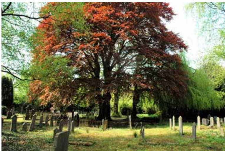
Oude begraafplaats Rheden.