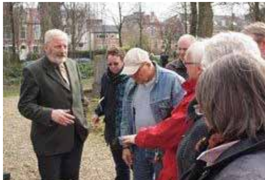
Tekst en uitleg